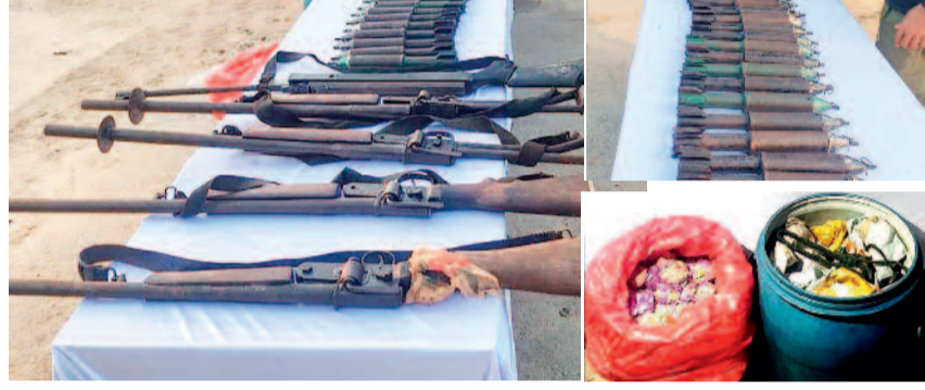
सुरक्षाबलों की तत्परता से टली बड़ी घटना

अधिकारियों के अनुसार, यदि यह डंप समय रहते नहीं मिला, तो नक्सली आईईडी और बीजीएल बमों के जरिए सुरक्षा बलों या आम नागरिकों को निशाना बना सकते थे। बरामद विस्फोटकों की मात्रा और प्रकार नक्सलियों की नश्वरता की गंभीरता को दर्शाते हैं। सुरक्षाबलों की सतर्कता, बेहतरीन समन्वय और त्वरित कार्रवाई से इस पूरे खतरे को पूरी तरह निष्क्रिय कर दिया गया। कानूनी कार्रवाई जारी, जांच तेज जब्त समस्त सामग्री को थाना छोटेबेटिया लाकर विधिवत वैधानिक कार्रवाई की जा रही है। मामले की जांच जारी है और यह पता लगाने के प्रयास किए जा रहे हैं कि यह डंप किस नक्सली संगठन या किस दस्ते द्वारा रखा गया था। अधिकारियों का कहना है कि लगातार चल रहे नक्सल विरोधी अभियानों के कारण नक्सलियों पर दबाव बढ़ा है, जिसके चलते वे अपने हथियार और विस्फोटक जंगलों में छिपाकर भागने को मजबूर हो रहे हैं।