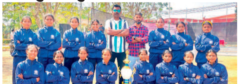
मानुप्रतापपुर

इंस्ट्रि जोन इंटर यूनिवर्सिटी खो-खो महिला प्रतियोगिता में शहीद महेंद्र कर्मा विश्वविद्यालय, बस्तर की महिला टीम ने शानदार प्रदर्शन करते हुए ऑल इंडिया इंटर यूनिवर्सिटी खो-खो महिला प्रतियोगिता के लिए क्वालीफाई कर विश्वविद्यालय के इतिहास में स्वर्णपद अर्जित किया। इस टीम में मानुप्रतापपुर की बेटियों ने कमाल कर दिखाया है। इंस्ट्रि जोन इंटर यूनिवर्सिटी खो-खो महिला प्रतियोगिता का आयोजन एसोसिएशन आफ इंडियन यूनिवर्सिटीज के तत्वावधान में उड़ीसा के बालेश्वर में 10 से 13 फरवरी तक हुआ। इस प्रतिष्ठित प्रतियोगिता में सात राज्यों के 37 विश्वविद्यालयों की सहभागिता रही, जिससे मुकाबले बेहद प्रतिस्पर्धात्मक रहे। प्रतियोगिता के नॉकआउट चरण में शहीद महेंद्र कर्मा विश्वविद्यालय की खिलाड़ियों ने दमदार खेल दिखाते हुए बस्तर विश्वविद्यालय ने सीएसटी यूनिवर्सिटी भिलाई, मां मानिकेश्वरी यूनिवर्सिटी तथा यूनिवर्सिटी ऑफ बर्धमान जैसी मजबूत टीमों को पराजित किया। खिलाड़ियों ने अदम्य साहस, बेहतरीन तालमेल और उत्कृष्ट तकनीक का परिचय देते हुए हर मुकाबले में श्रेष्ठता साबित किया। इस ऐतिहासिक सफलता के साथ विश्वविद्यालय की महिला टीम ने पहली बार ऑल इंडिया इंटर ►►शेष पेज 12 पर